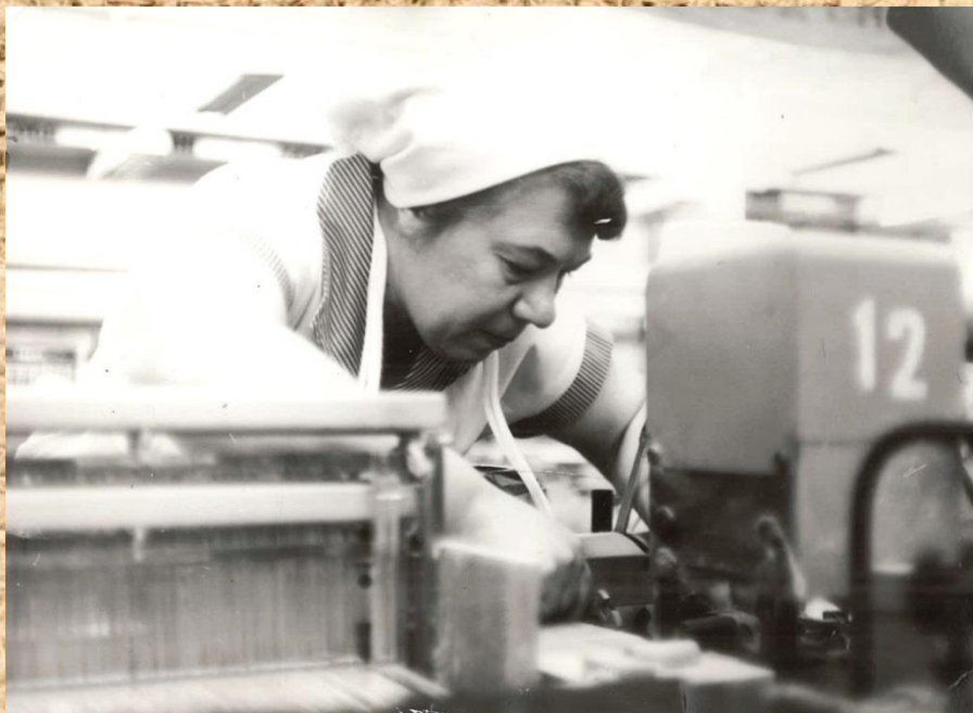
Фонд Р-1183л/п, Опись -1л/п, Дело 7, Лист 1