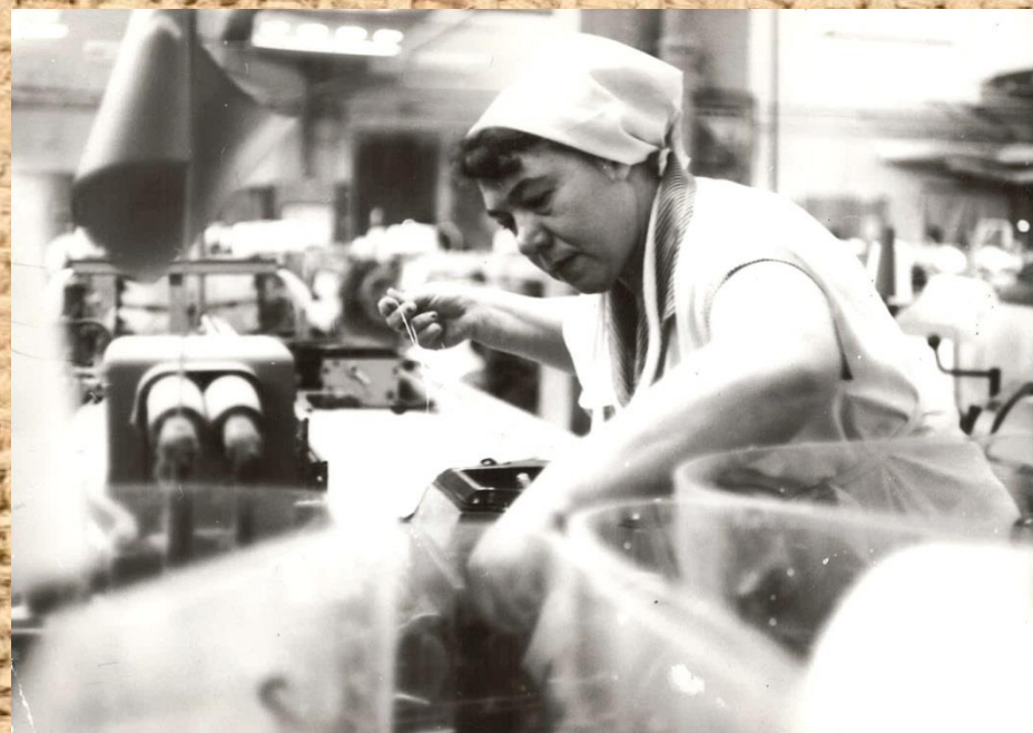
Фонд Р-1183л/п, Опись -1л/п, Дело 7, Лист 3